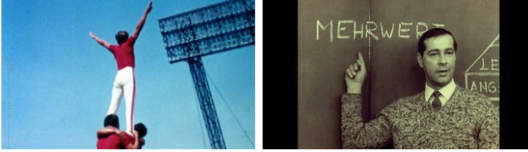
Phil Collins 2010, HD video, 35'

Phil Collins'in film, video ve fotoğraf alanlarındaki çalışmaları çoğu zaman gözden kaçırılan ya da mahrum edilen şeylere bir platform oluşturmayı hedefliyor. günümüzde marksizm , son yirmi yılda yaşanan siyasal ya da sosyal başkaldırılarda kaybeden tarafı inceleyen bir proje niteliğinde. Collins'in Komünist Alman Demokratik Cumhuriyeti'ndeki eski Marxizm-Leninizm öğretmenlerinin yaşamlarını ve servetlerini takip ederek başlayan 2010 tarihli kısa filmi 'Günümüzde Marxizm (giriş)' ilk kez 6. Berlin Bienali'nde gösterilmişti. Eski öğretmenlerle gerçekleştirilen güncel röportajların yanı sıra arşiv malzemelerin kullanıldığı film, eski Alman Demokratik Cumhuriyeti'ndeki yaşamdan gündelik kareleri, öğretmenlerin bireysel hatıraları ve 1989 yılında yıkılan Berlin Duvarı'nın ardından yaşadıkları farklı deneyimleri beyaz perdeye taşıyor.