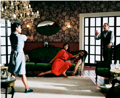
Phil Collins 2008, 16 mm film transferred to video, 28'

Jane ve Marc Nathanson Seçkin Sanatçı Rezidansı Programı'nın bir parçası olarak Aspen Sanat Müzesi tarafından 2008 yılında ısmarlana bu çalışmasında Collins, Amerika'nın Colorado eyaletindeki Latinler'e ve göçmen nüfusuna odaklanıyor. Collins'in yakından incelediği bu nüfusun önemli bir kısmı Meksika'nın kuzeybatısından geliyor. Sadece