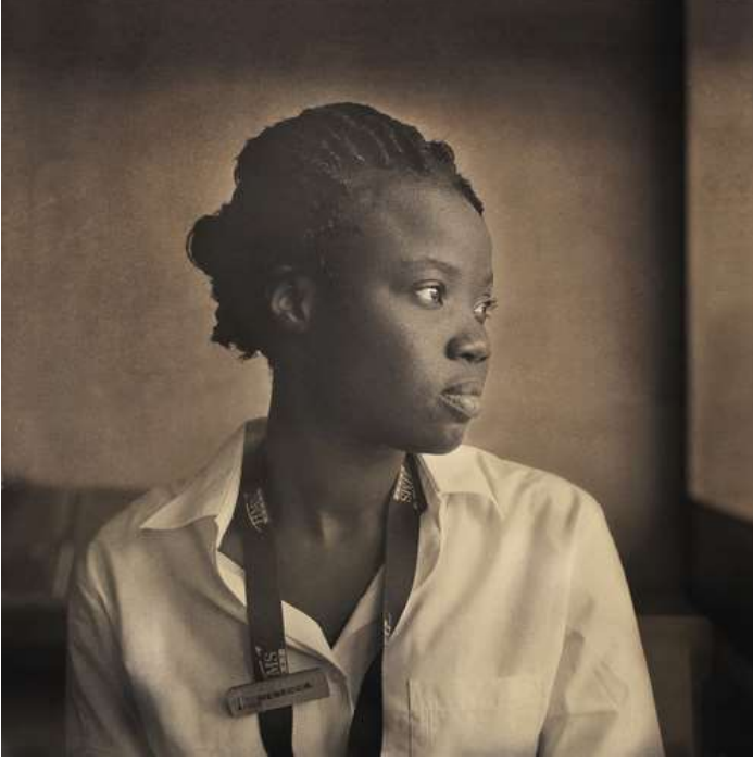
hennessey portre ödüllü “beckah”