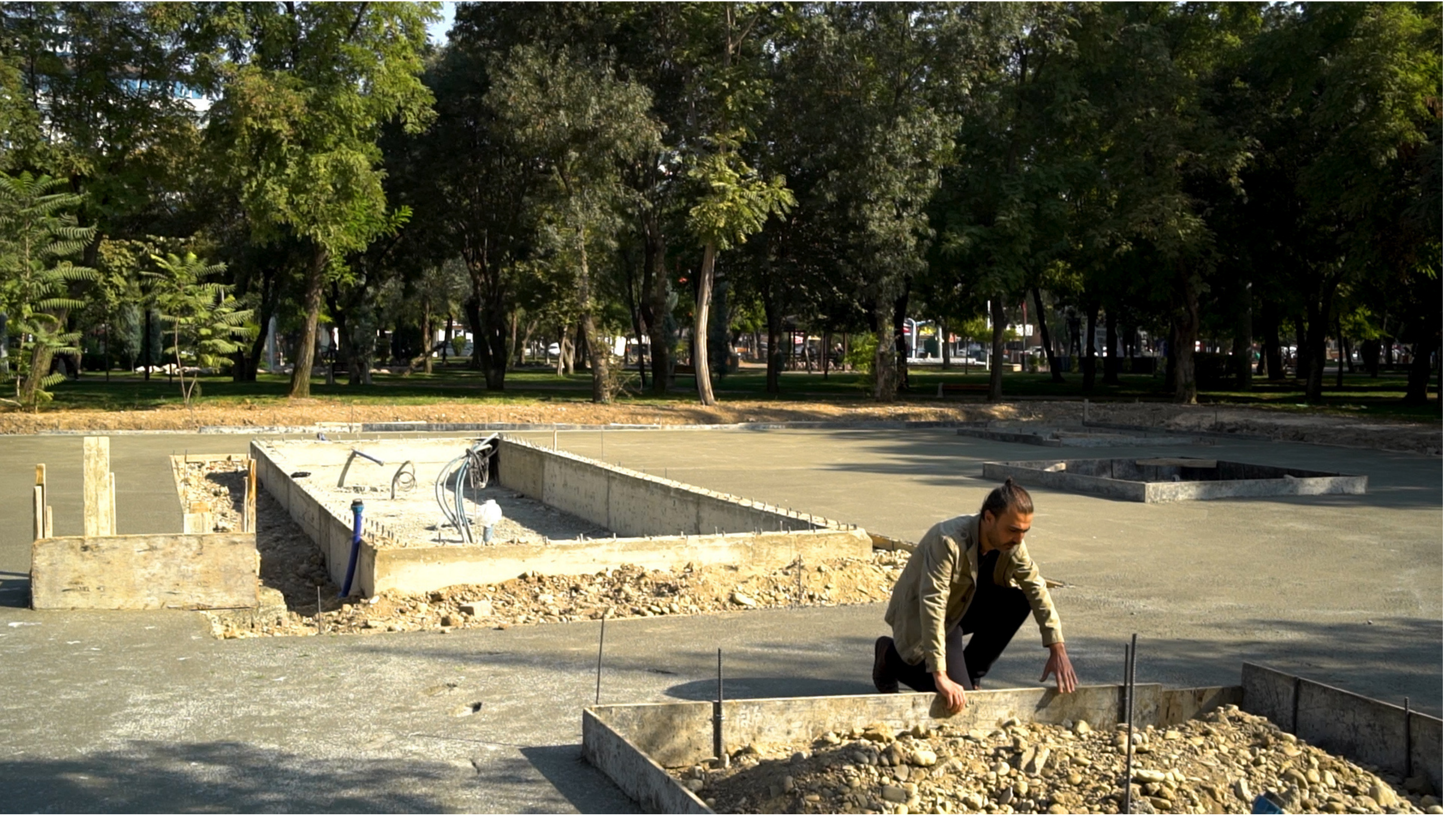
Li Vir (Burada)