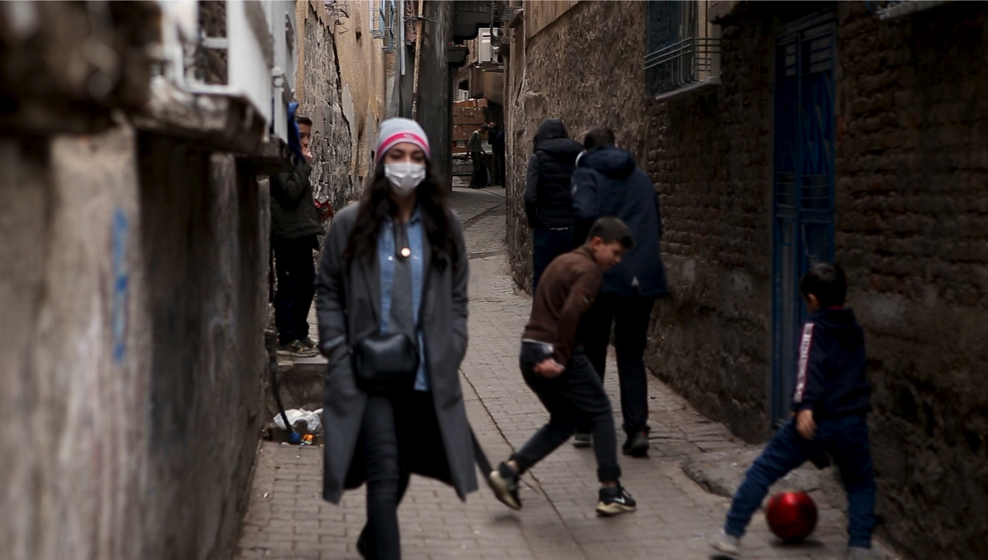
Yönetmen Fatoş Güneri Video, 5'29", Şubat 2021 Diyarbakır

Diyarbakır'ın dar sokaklarında yolunu kaybeden Fatoş fallarla yönünü bulmaya çalışır. Falcıların her cümlesi onu başka bir yola sürükler; hiç bilmediği ama ona çok tanıdık gelen sokaklardan istemese de geçecektir. Diyarbakırlı falcıların sesleriyle şehrin sokaklarının belgesel görüntülerini buluşturan Bir Çember Düşün , çocukluk mekânının hafızasını bir arayışa dönüştüren, sonu aydınlığa çıkan bir yürüme halinin filmi.