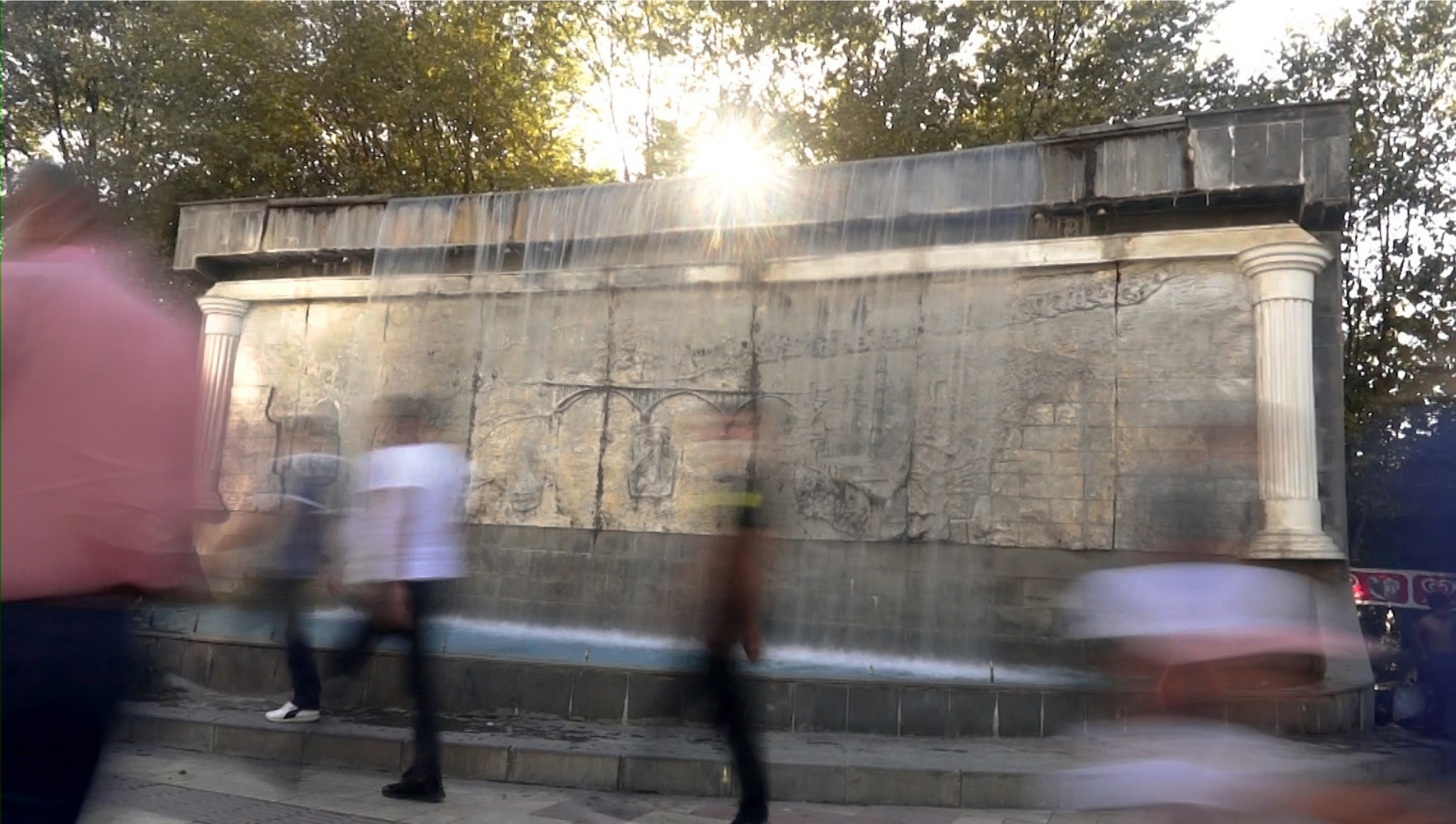
Yönetmen Nalin Acar Video, 5'14", Şubat 2021 Batman

Ilisu Barajı ile sular altında kalan Hasankeyf artık Batman'da sadece bir süs havuzunun duvarlarını süslüyor. Bu süs havuzu da tıpkı tarihî Hasankeyf gibi kendi ekosistemini yaratıyor. Görüntüleri kavramlarla eşleyerek ve aynı kavramlara farklı görüntülerin bağlamında yeniden dönerek ilerleyen Taş ve Su , izleyiciyi yeniden bakmaya ve anlamaya davet ederken tanık olmanın ağırlığına işaret ediyor.