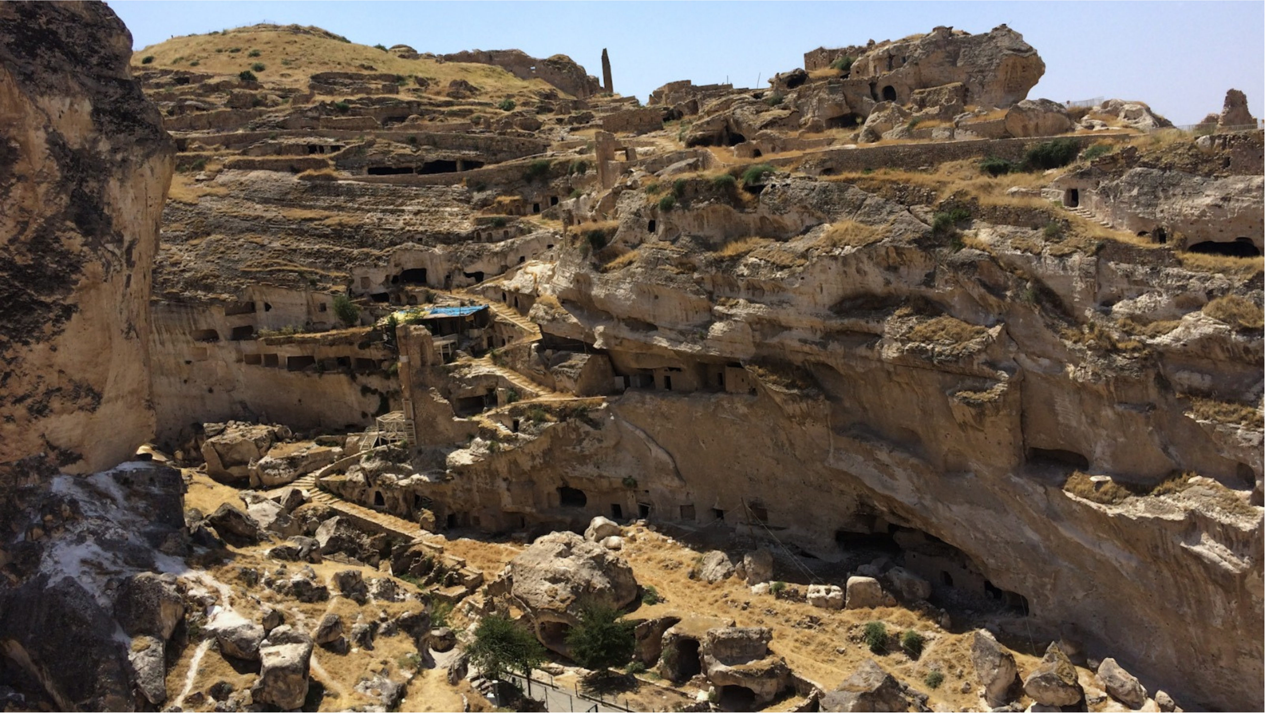
Taş ve Su