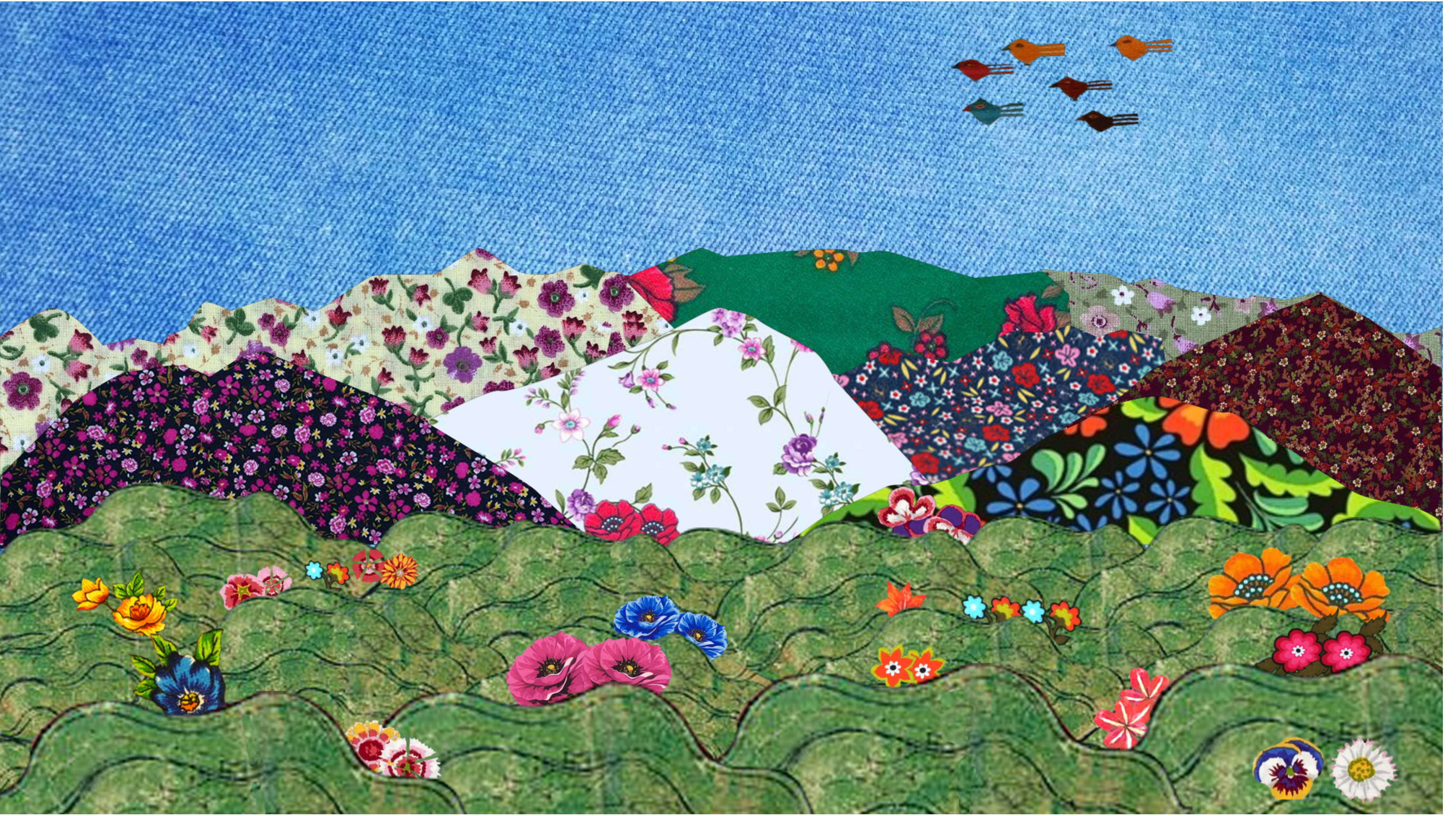
Cûdîyê Miradan (Dileklerin Cudisi)