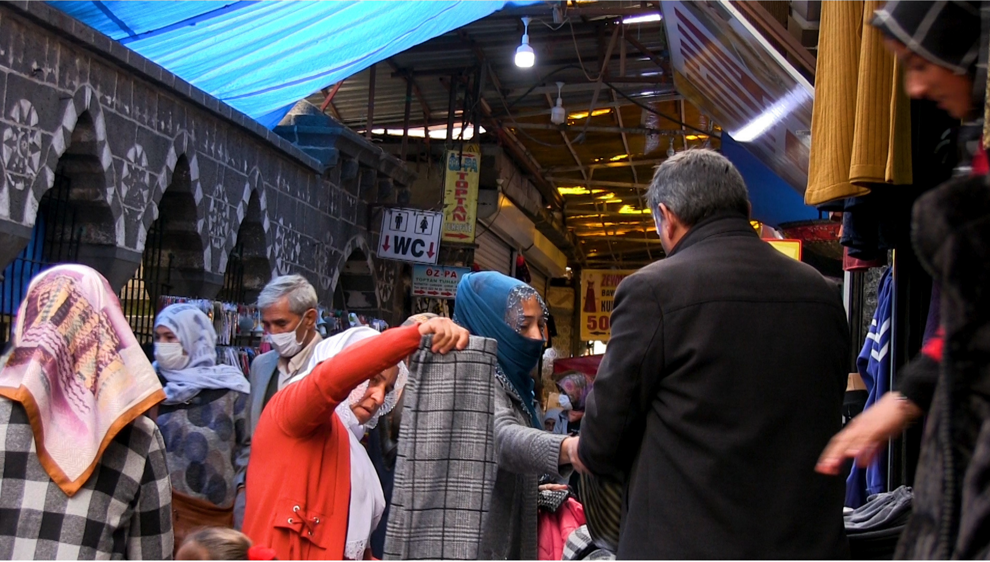
Yönetmen Zelal Sadak Video, 5'21", Şubat 2021 Diyarbakır

Kimsenin tohumunu atmadığı, sulamadığı, çitleriyle topraklarının sınırlarını belirlemediği yerlerde biten otları toplayan kadınları kimler hatırlıyor? Aşefçiler, Rüyalar, Otlar , Diyarbakır Suriçi'ndeki meşhur çarşıya adını veren aşefçi kadınların bugünkü yokluğunu çok sesli bir fısıltılar korosuyla dolduruyor. Çarşının görünmez kılınmış tarihine, aşefçilerin otlarını topladığı Hevsel Bahçeleri'nin ışığı düşüyor.