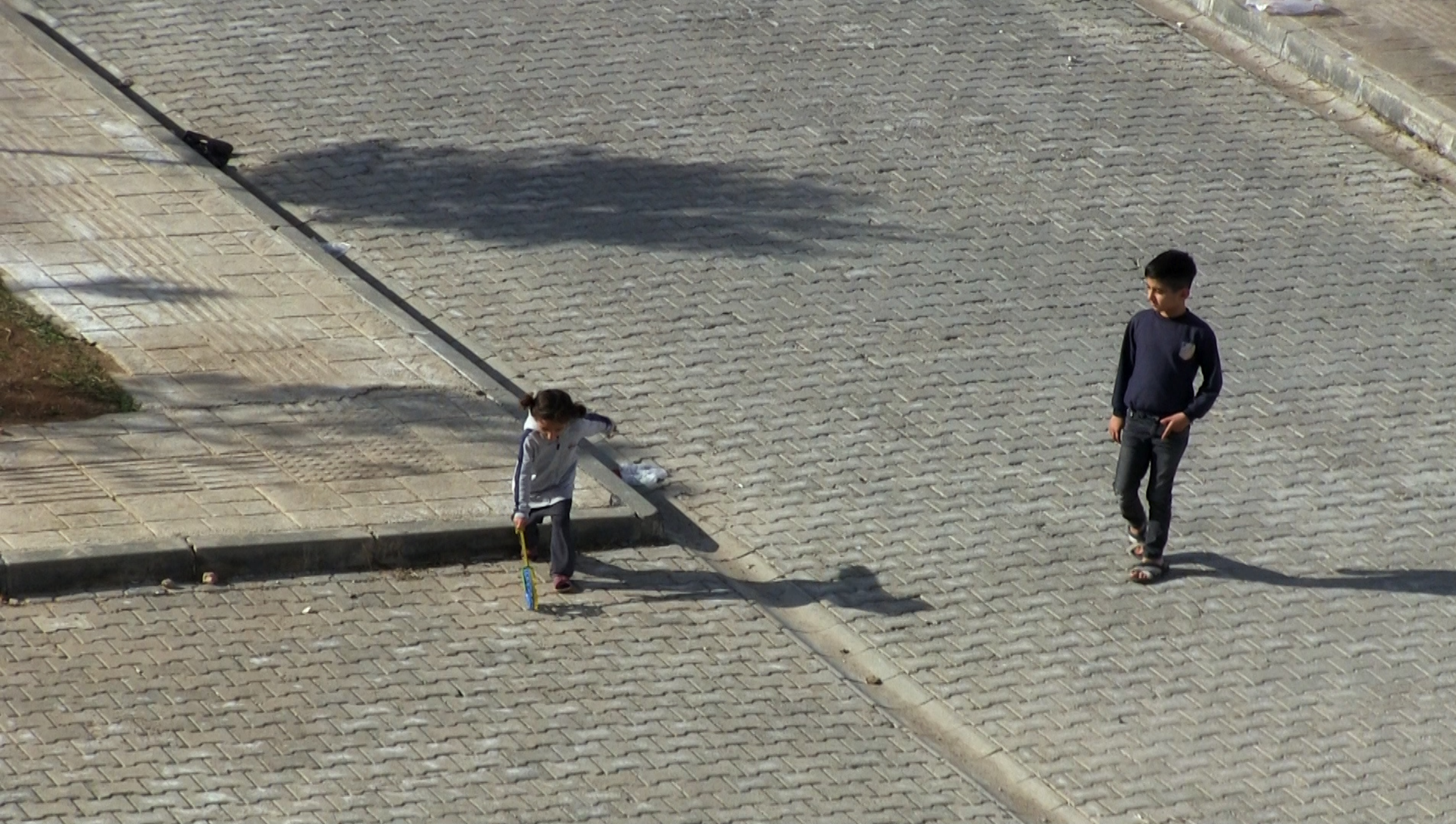
Yönetmen Rozerin Tadik Video, 4'13", Şubat 2021 Mardin

2014-2016 seneleri arasında Kürt şehirlerinde yaşanan çatışmalar esnasında yıkılan binlerce ev arasında Rozerin'in kardeşleri ve kuzenleriyle beraber toplamda 11 kişinin doğduğu ve büyüdüğü dedesinin evi de vardı. 4 Aralık 2020, Nusaybin , yıkım sonrası aynı bölgeye inşa edilen toplu konutlardan birinin balkonundan yapılan bir telefon konuşmasıyla, iki kuzenin çocukluk anılarına kısa bir ziyaret.