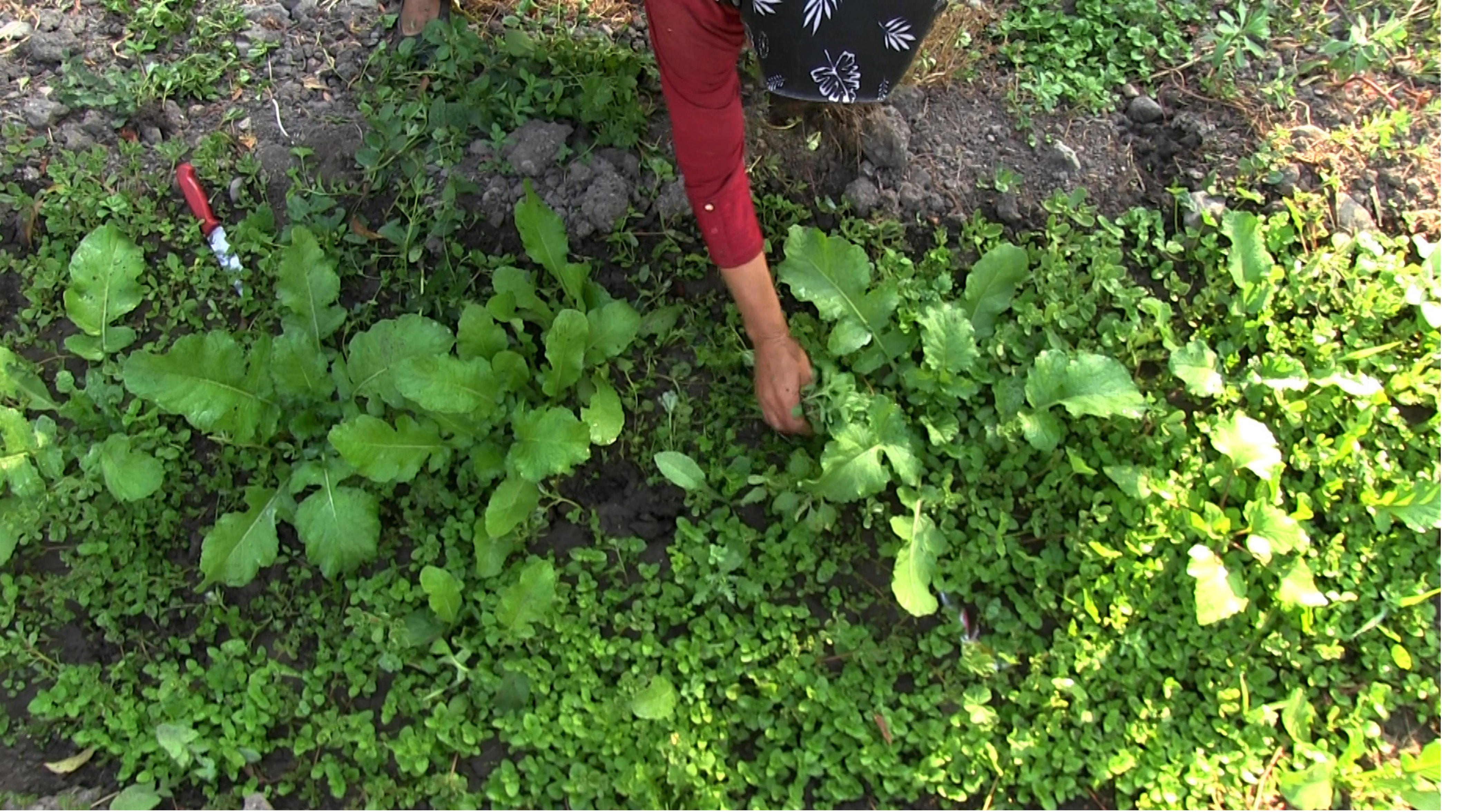
Aşefçiler, Rüyalar, Otlar