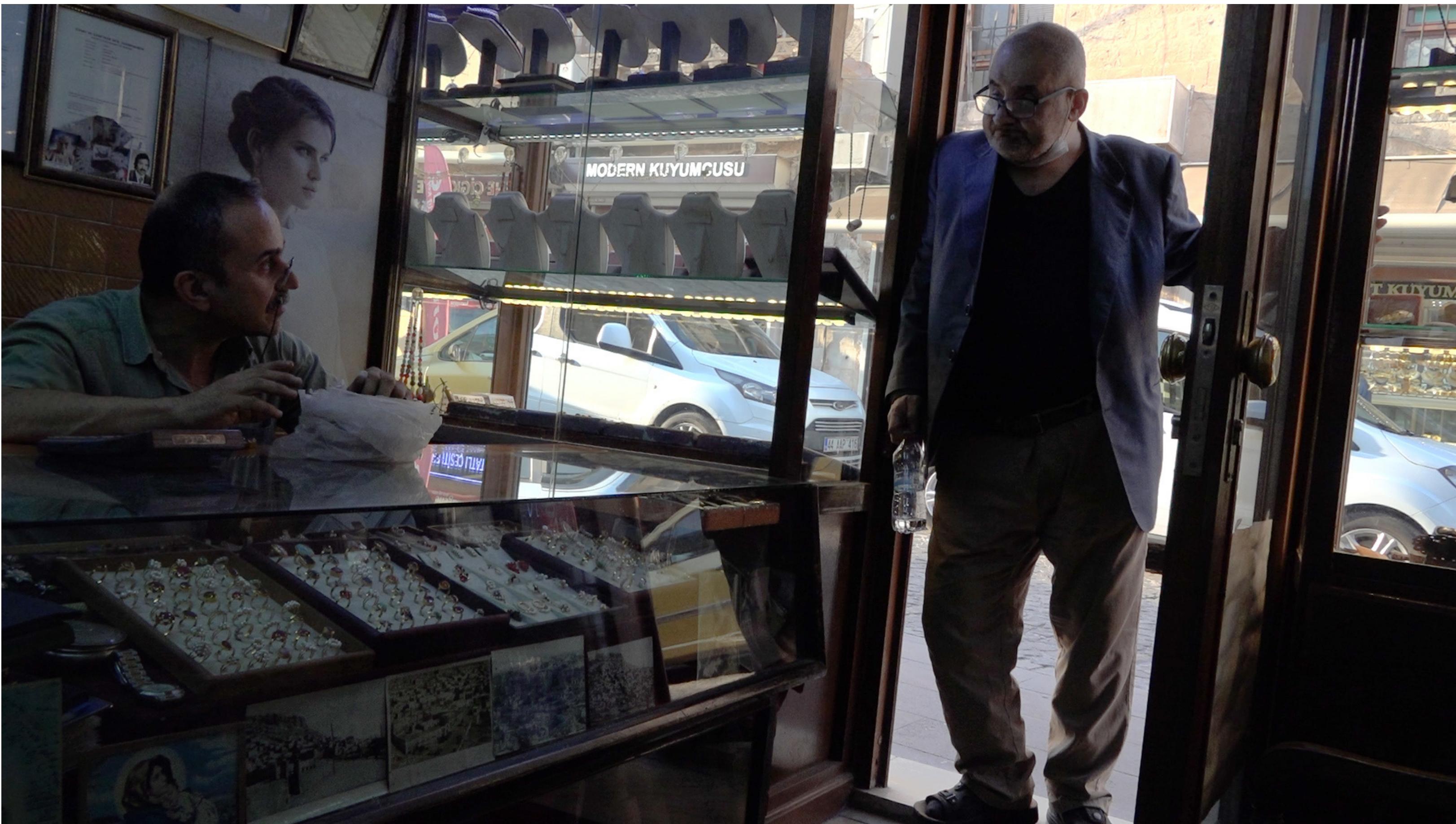
Yönetmen Mediha Güzelgün Video,11'47", Şubat 2021 Mardin