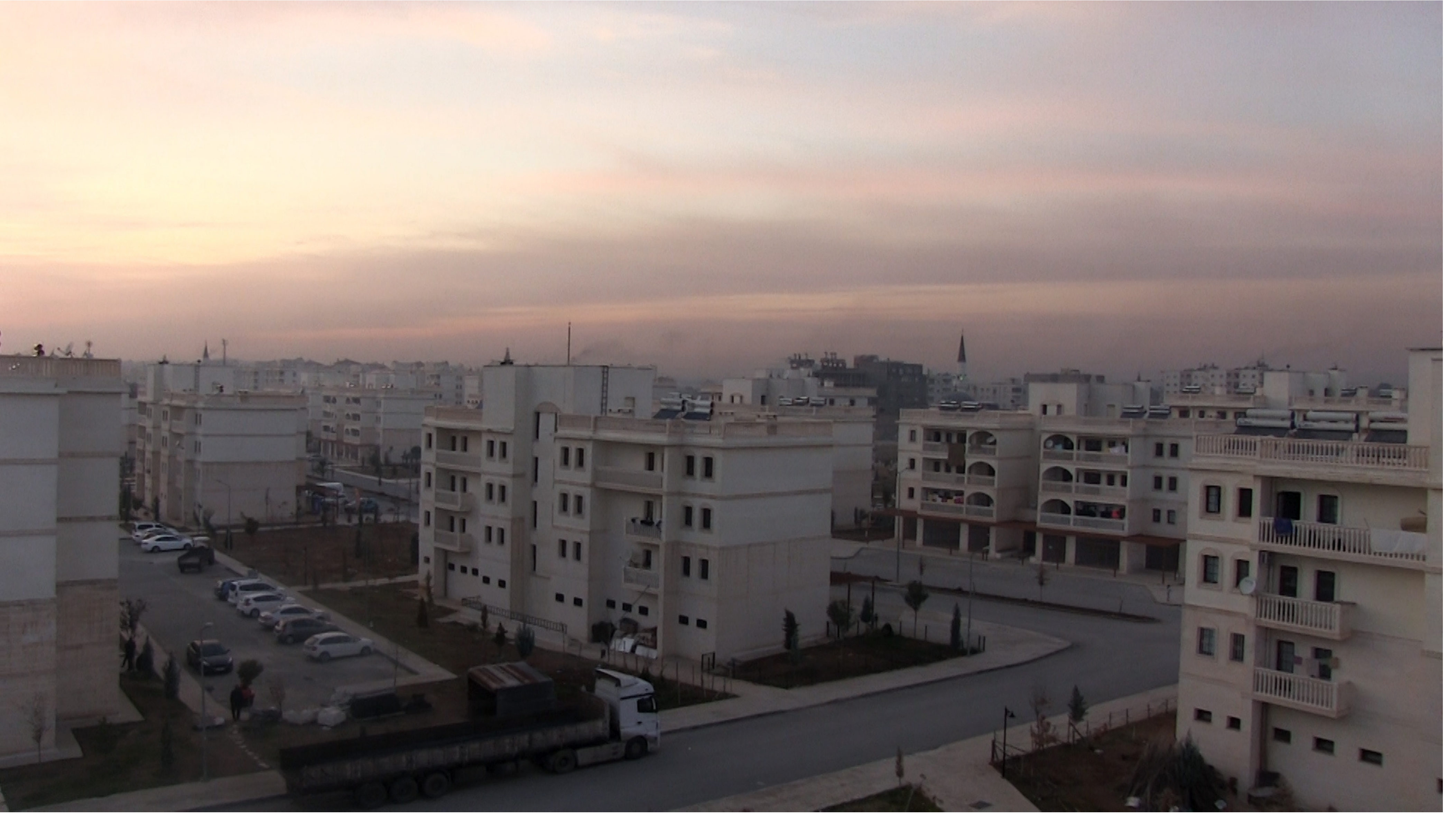
4 Aralık 2020, Nusaybin