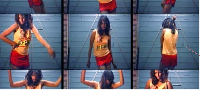
Yönetmen / Director: Steve Loveridge ABD, İngiltere, Sri Lanka / USA, UK, Sri Lanka, 2018, 97', renkli / color İngilizce, Tamil; Türkçe altyazılı / English, Tamil with Turkish subtitles

Film, Maya Arulpragasam'ın kendisi ve yakın arkadaşları tarafından 22 yıl boyunca çekilmiş görüntülerle Londra'da genç bir göçmenden uluslararası pop yıldızı M.I.A.'ya dönüşümünü anlatıyor. Kökenlerinden ilham alan M.I.A.'nın yolculuğunun her durağından ilhamla yarattığı karma, kopyala-yapıştır kimlik, Tamil siyaseti, sanat okulu punk'ı, hip hop ritimleri ve çok kültürlü gençliğin sesini bir araya getiren bir eskiz defteri. İlkelerinden taviz vermeyen Maya, başarılarının ve şöhretinin giderek arttığı ve günümüzün en provokatif ve tartışma yaratan sanatçılarından birine dönüşmesiyle sonuçlanan süreç boyunca, müzik endüstrisi ve ana akım medyayla yaşadığı mücadeleleri belgelemeye hiç ara vermemiş.