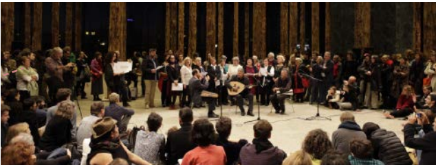
Performans / Performance: Aykan Safoğlu, Huzur e.V. Almanya / Germany, 2014, 12', renkli / color İngilizce; Türkçe altyazılı / English with Turkish subtitles

Çile Bülbülüm , performans sanatçısı Ulay'ın 1976'da gerçekleştirdiği Önceden Belirlenmiş 14 Adımda Eylem: Sanatın Kanunsuz Bir Yanı Var adlı sanat eylemine dayanıyor. Bu tartışma yaratan performansında Ulay, Carl Spitzweg'e ait 1839 tarihli Der Arme Poet (Fakir Şair) adlı orijinal tabloyu sergilenmekte olduğu