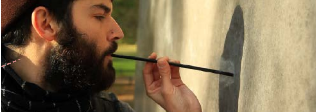
Video: Aykan Safoğlu, Almanya / Germany, 2013, 13', renkli / color Almanca; Türkçe altyazılı / German with Turkish subtitles

Güncel toplumsal cinsiyet teorisi alanının önde gelen isimlerinden Judith Butler 2010 yılında kendisine verilen “Berlin Onur Ödülü”nü almayı reddettiğinde, yaptığı basın açıklamaları, Almanya'da gay ve lezbiyenlere ilişkin siyasi tartışmaları daha da alevlendirdi. Görsel materyaller, yaşanan tartışmalara ilişkin haber kupürleri ve kültürel tarihten ödünç alınan tartışmaları bir araya getiren Safoğlu'nun bu video çalışması, kapitalist konformizm, ırkçılık, cinsiyet politikaları ve “homonasyonizm” gibi bu tartışmaların merkezinde yer alan motifleri irdeliyor. Eser, Berlin Maxim Gorki Tiyatrosu'nun siparişi üzerine hazırlandı.