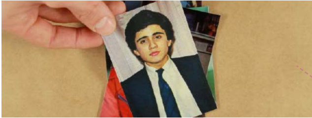
Yönetmen / Director: Aykan Safoğlu Türkiye, Almanya / Turkey, Germany, 2013, 24', renkli / color Türkçe; İngilizce altyazılı / Turkish with English subtitles

Eserlerinde toplumu etkileyen meselelere büyük yer vermiş Amerikalı yazar James Baldwin ile kurgusal bir diyalog olarak tasarlanan, Oberhausen büyük ödülü sahibi Kırık Beyaz Laleler , otobiyografi türünün sınırlarını yenilikçi bir şekilde genişleten bir essay film. Yazarın İstanbul'da geçirdiği zamanı belgeleyen kartpostal, gazete kupürlerini ve Sedat Pakay'ın fotoğraflarını yaratıcı bir çağrışımlar zinciriyle Türk ve Amerikan popüler kültüründen imgelerle buluşturan bu kolaj, bunun sonucunda ırkçılık, uluslararası diyalog ve LGBT politikaları gibi konulara incelikli bir eleştiri getirirken, yalnızca fikirleri üzerinden tanıdığımız insanların kendi kişisel tarihimizi nasıl etkileyebildiklerine dair çarpıcı bir örnek sunuyor..