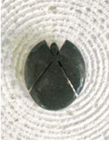
Duygu Soley / Nunc

doğum .....haziranın 2 sinde 1982 in adanasında ..... toprağa ve denize yakın bir ilk yıllar.... ilk ve orta öğretim adana anadolu lisesinde, iç mimarlık eğitimi istanbul da, ardından yüksek lisans; sanat yönetimi... topraktan uzak alınan nefesler şampiyon olma sevinci ....dans dünya ve avrupa şampiyonlukları..... aşçılık eğitimi ....gönlünü kaptırıp bozcaada ya yerleşim,,, toprağa ve denize dönüş .....sevincin doğması Aia çocuk 2012 arınmanın ürünü taştan melekler..... yaşamda an ın degeri kavramı ve an ın yakalandığı ...nunc bozcaada bende olanların bana ,size ulaştığı ana döngü doğanın üretkenliğinde ona yaklaşma tıbbi ve aromatik bitki çiftçiliği ... ...arınmaya giden yolda mutlu bir yolculuk ölüme giden yolda...ışıkla ,,,