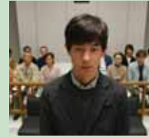
© 2007 FUJI TELEVISION / ALTAMIRA PICTURES / TOHO