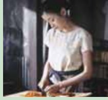
© EISEI GEKKO, BANDAI VISUAL, NIPPON SKY WAY, TV TOKYO, MEDIANET, A&I PROMOTION, PAL ENTERTAINMENT'S PRODUCTION