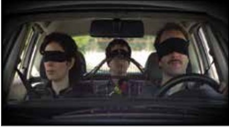
Kafes, Oğuzhan Akalın 2012 (12')

Hayatının en büyük amacı bir araba almak olan Baba, nihayet arabasını almış ve ailesiyle birlikte evine dönmüştür. Aile, apartmanda