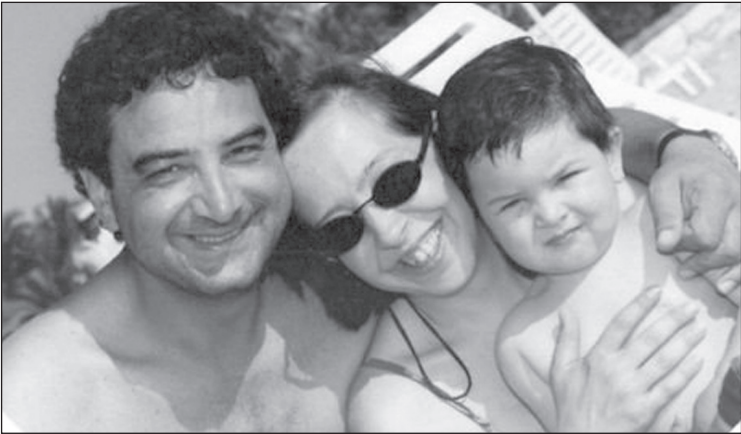
Cebenoyan eşi ve oğluyla