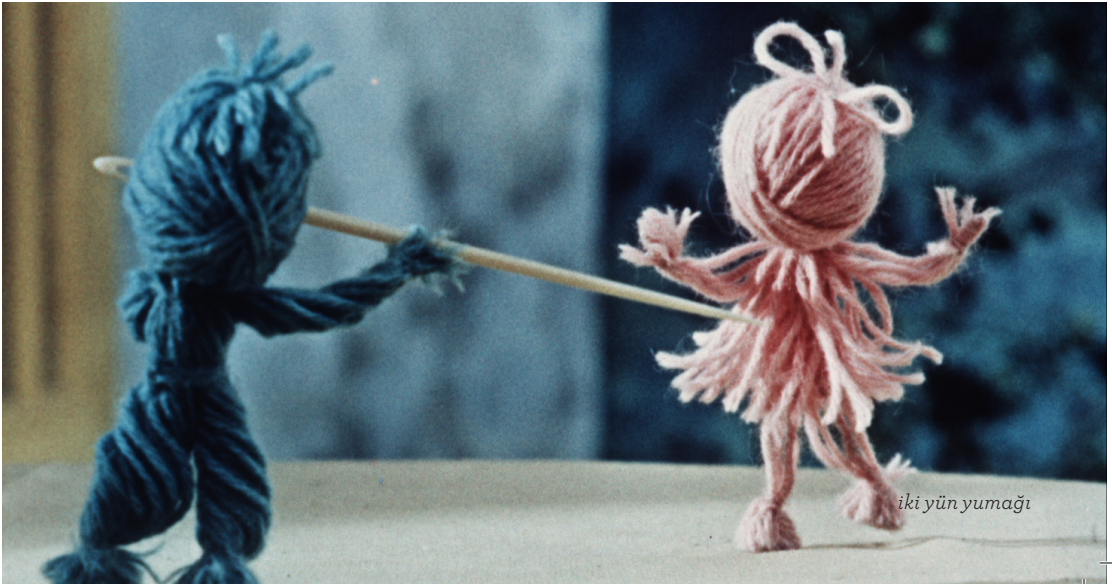
iki yün yumağı