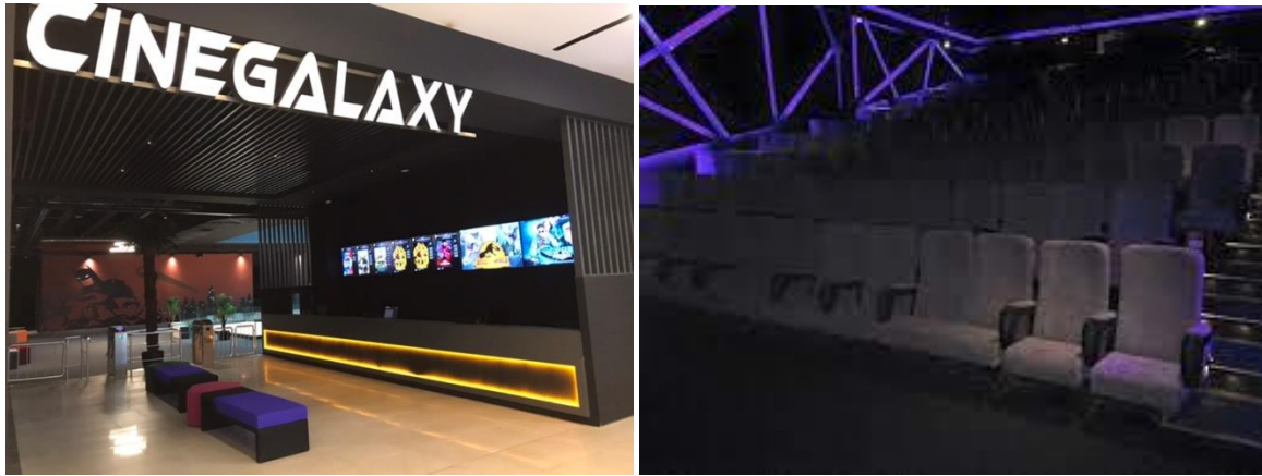
Rize, ve Trabzon'da açılan Cinegalaxy sineması... Cinegalaxy theatres in Trabzon and Rize cities...

Contrary to the number of closed cinemas, which cannot have an unusual appearance despite the epidemic, the number of theatres opened since 2020 is very pleasing. Starting from the closed period, the first film was screened on 116 cinema screens in 28 new locations in 20 provinces in Turkey. 13,075 seats were added to the total country seat capacity. Five of the newly opened locations were in Istanbul, and one each in Izmir and Ankara. In the provincial centers of Mardin, Siirt, Mersin, Bursa, Kocaeli, Manisa, Muğla, Sakarya, Yozgat, Erzurum, Batman, Kastamonu, Ağrı, Elazığ, Van, Rize, Isparta, Sinop, Adana, Şırnak, Artvin, Kütahya, Niğde and in its districts, new cinema companies have set up for movie screenings.