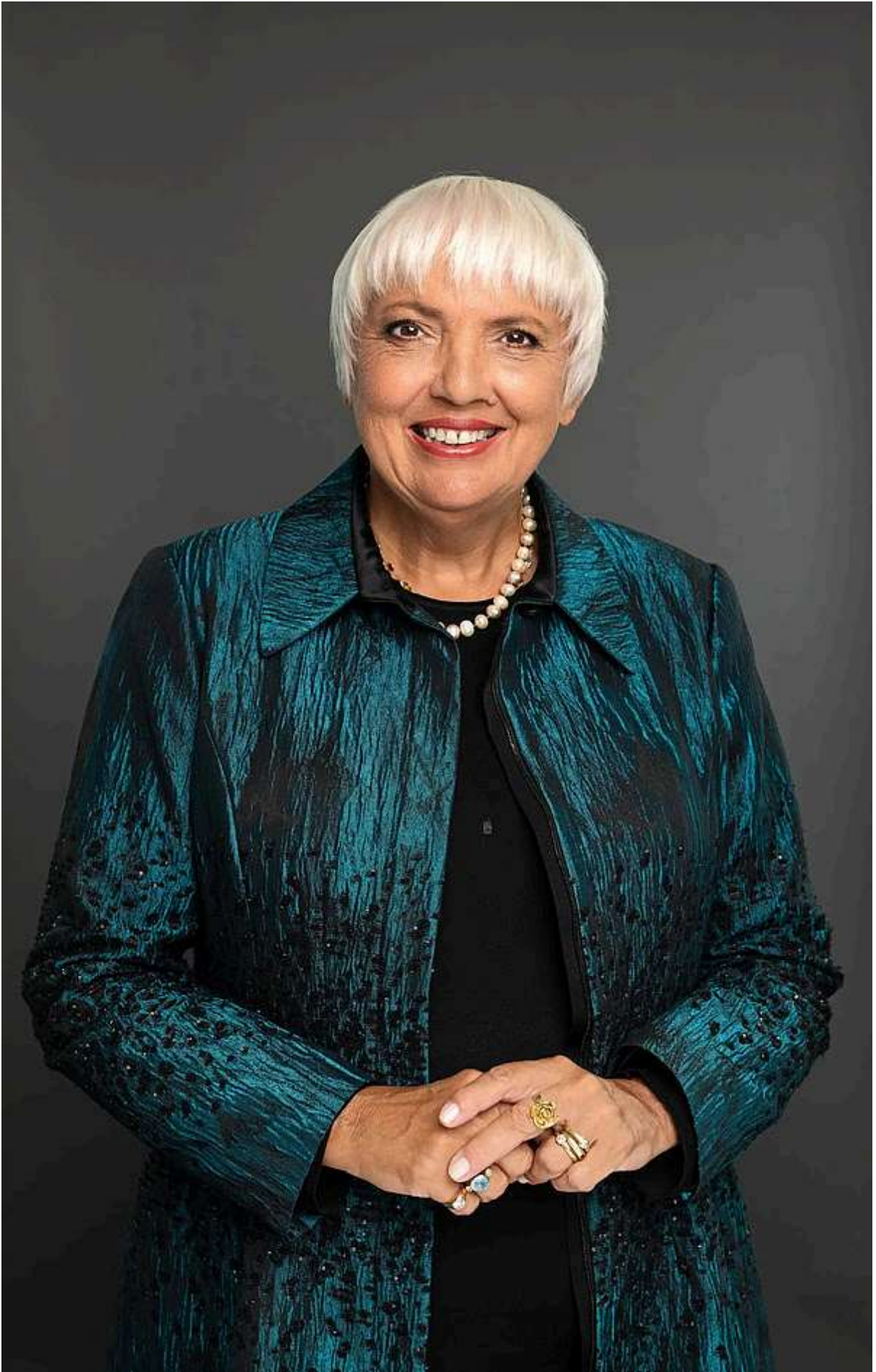
Federal Kltr Devlet Bakanı Claudia Roth