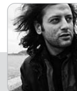
Erdem Murat Çelikler

En İyi İlk Film - Antalya Uluslararası Altın Portakal Film Festivali, Türkiye, 2010 Best First Film - International Antalya Golden Orange Film Festival, Turkey, 2010